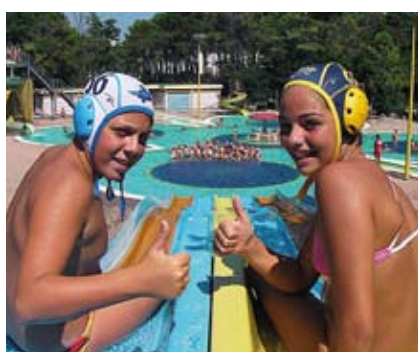
CALOTTA E VIA Due giovani pallanuotisti iscritti al corso "WP Camp" di Lignano Sabbiadoro.