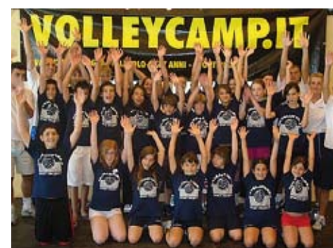
MINI PALLAVOLISTI Foto di gruppo per uno dei team iscritti a un passato "Volley Camp".