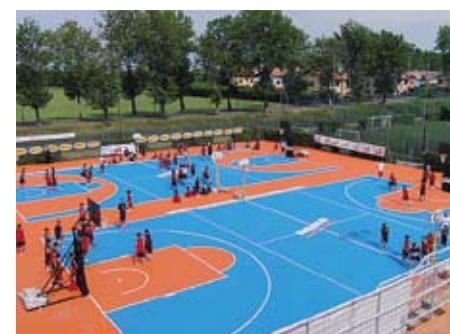
UN'OASI DI BASKET Vista dall'alto per i campi da basket del "Villaggio Marzotto" di Jesolo.

Il corso: stage settimanali da due sessioni in acqua e una teorica per agonisti o pre-agonisti destinati a ragazzini e ragazzi a partire dagli 8 anni. Il programma, che prevede analisi della tecnica di nuotata, di partenza e virata dei quattro stili, è studiato e portato avanti in acqua da Giovanni Franceschi, vincitore di due medaglie d'oro nei 200 e 400 misti agli Europei di Roma 1983 e di 41 titoli nazionali individuali.