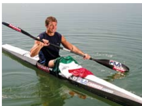
UN UOMO D'ORO L'ex canoista Antonio Rossi, 42. Lecchese, ha vinto, tra l'altro, tre ori olimpici.

Il corso: dopo aver vinto sei ori (equamente divisi tra Olimpiadi e Campionati del mondo), adesso Antonio Rossi porta la sua canoa nella bellissima cornice del "Colonna Beach" di Golfo Aranci, di fronte all'isola di Tavolara, per insegnare ad aspiranti canoisti di tutte le età i segreti di questa disciplina e, soprattutto, per fornire programmi di allenamento che possano costruire una base adeguata per progredire in uno sport dove fatica e allenamento costante sono fattori di primaria importanza.