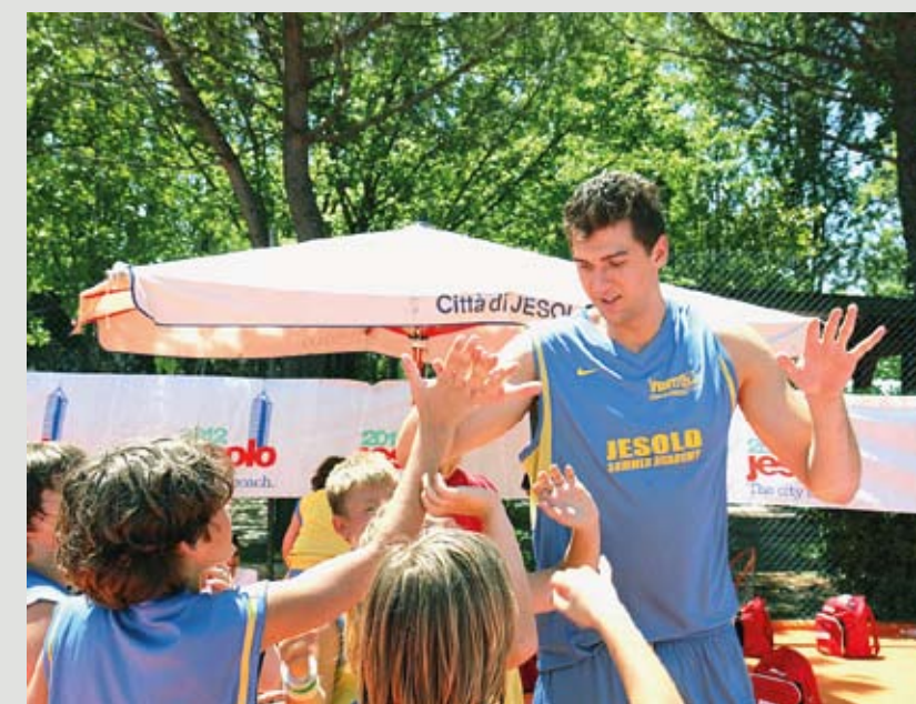
CHE MAESTRIA La lezione di tennis dell'ex campione australiano Pat Cash e, sopra, "Il Mago" Andrea Bargnani circondato dai suoi giovanissimi allievi per una lezione di basket a Jesolo.

è per il periodo 27 luglio-6 agosto e con il secondo dal 22 agosto al 5 settembre. Il vantaggio è quello di poter approfittare della loro disponibilità: ogni giorno, entrambi passano ore sul campo per correggere giovani (e meno giovani) tennisti di qualsiasi livello: «In pochi giorni non possiamo fare miracoli», dice Björkman, 39 anni. «Ma talvolta bastano piccoli accorgimenti per compiere progressi interessanti. Soprattutto nell'aspetto tattico». E se Enqvist e Björkman non dovessero bastare, ci sono altre opzioni: Karol Kucera (1-10 luglio), Paul Haarhuis (11-22 luglio) e Magnus Gustafsson (10-20 giugno), tutti Top 10 tra singolo e doppio.